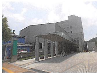
◀仙台市医師会館外観

■仙台市医師会館 (仙台市急患センター併設になっています) 最寄駅/地下鉄南北線「河原町駅」 宮城県仙台市若林区舟丁 64-12