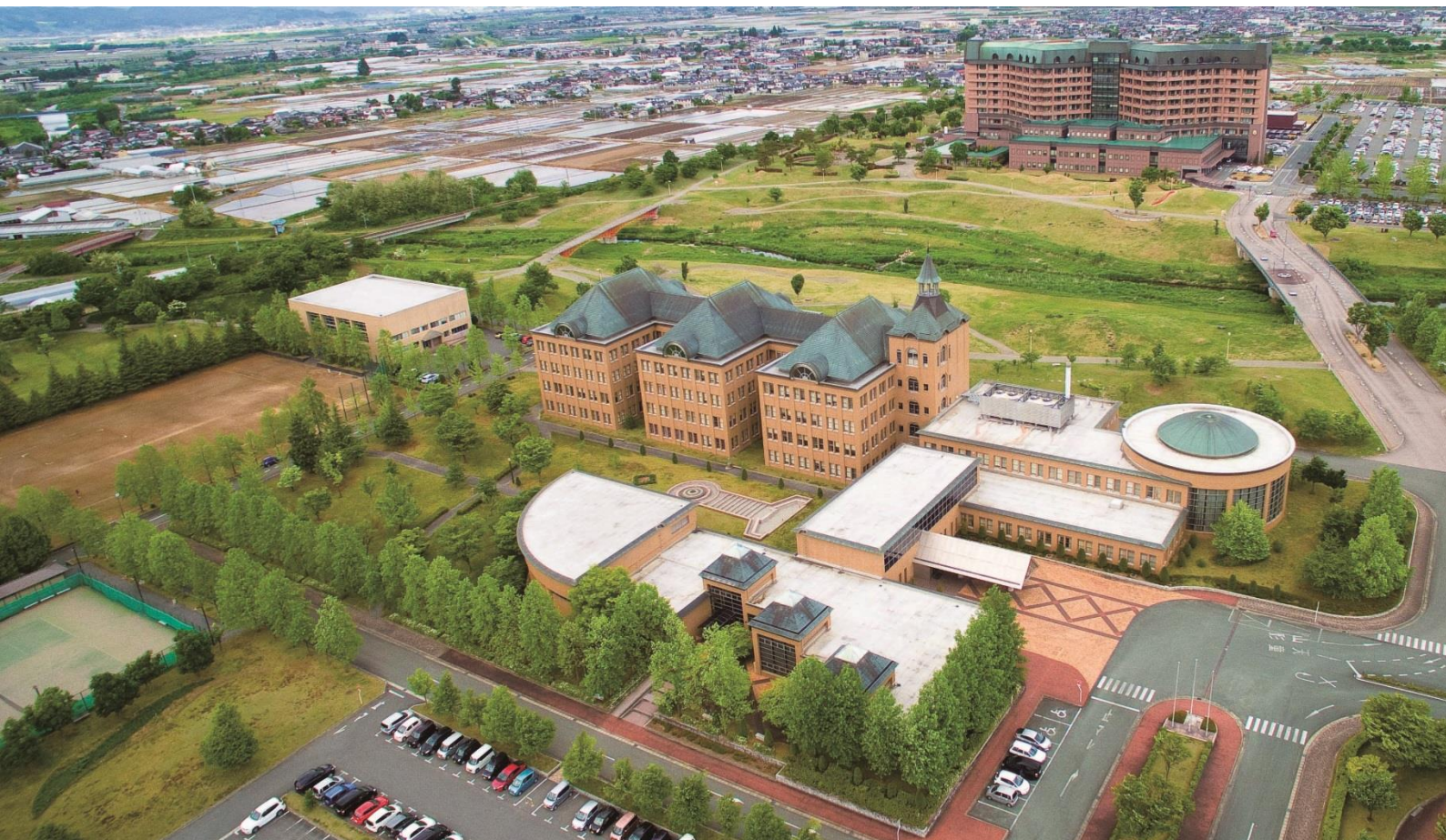
写真：山形県立保健医療大学全景